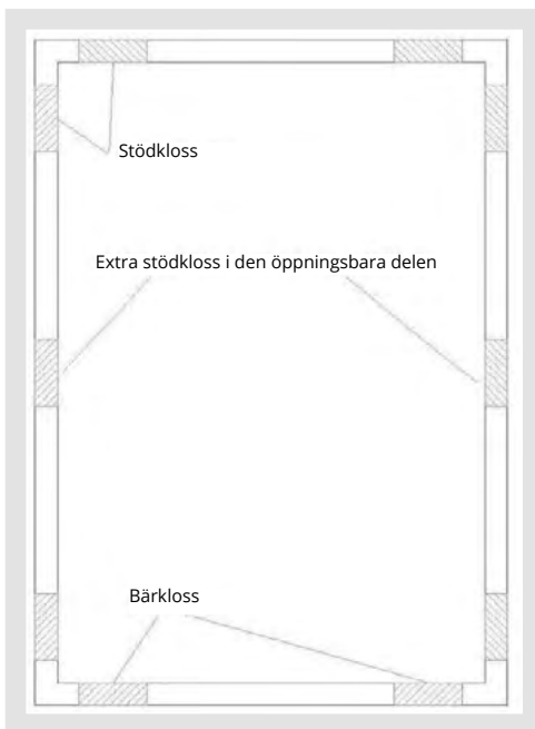
Stödkloss, bärkloss och extra stödkloss i öppningsbar del.